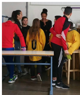
Atelier « Initiation et découverte de l'improvisation »