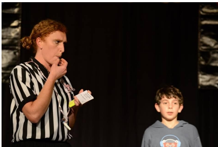
Arbitrage d'un match d'improvisation